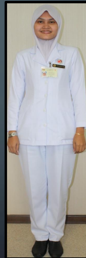
PEMBANTU PERAWATAN KESIHATAN (PEREMPUAN)