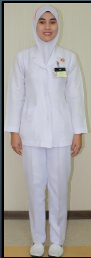
PEMBANTU PEMBEDAHAN PERGIGIAN (PEREMPUAN)