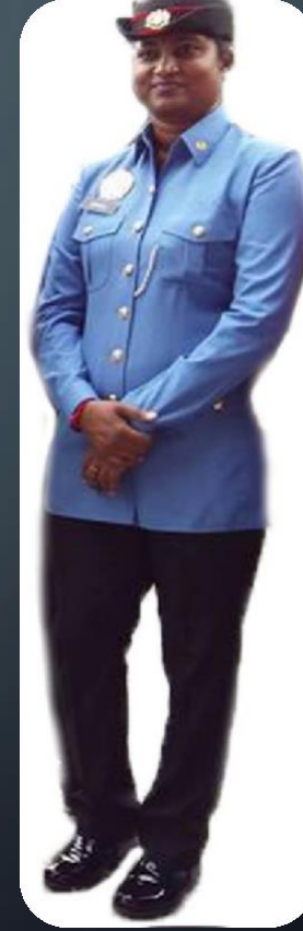
Pegawai Keselamatan (PEREMPUAN)