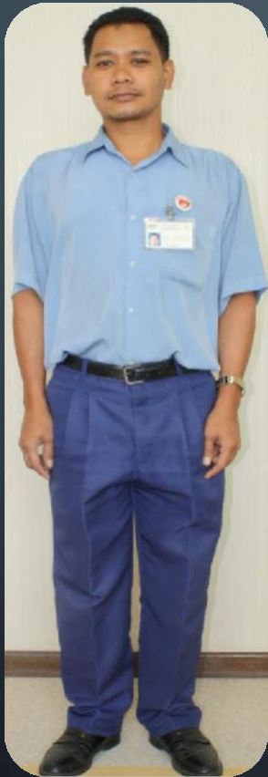
PEMBANTU AM PEJABAT (LELAKI)