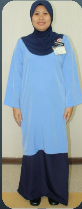
PEMBANTUAM PEJABAT (PEREMPUAN)