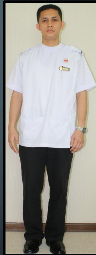
JURURAWAT TERLATIH (LELAKI)