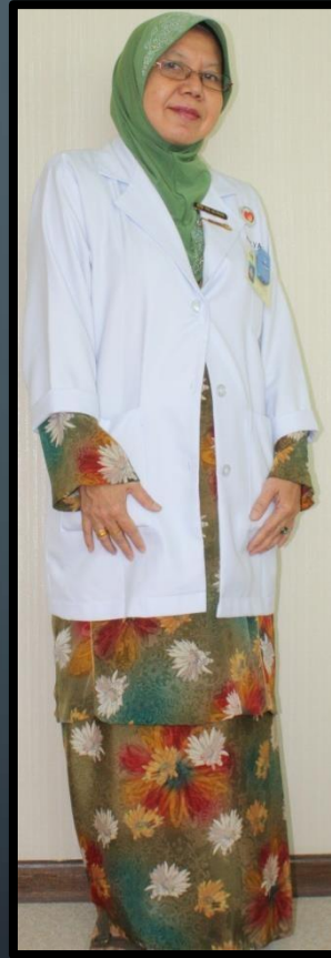
JURU X-RAY (PEREMPUAN)