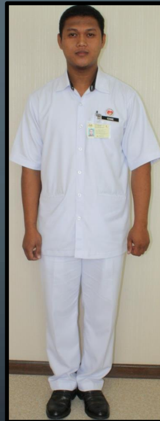
PEMBANTU PERAWATAN KESIHATAN (LELAKI)