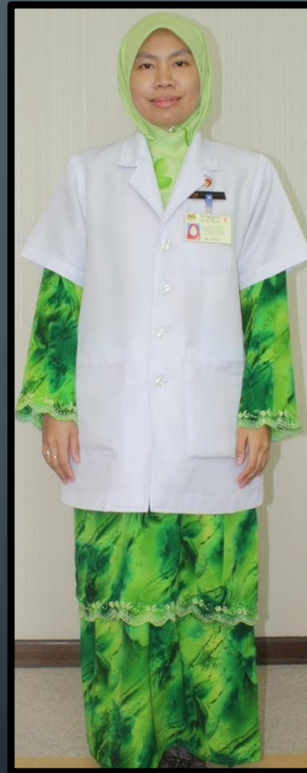
PEGAWAI DIETETIK (PEREMPUAN)