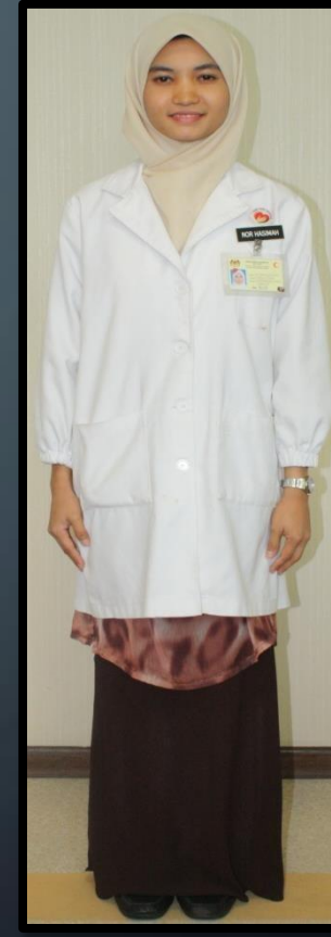
JURUTENOKLOGI MAKMAL (PEREMPUAN)