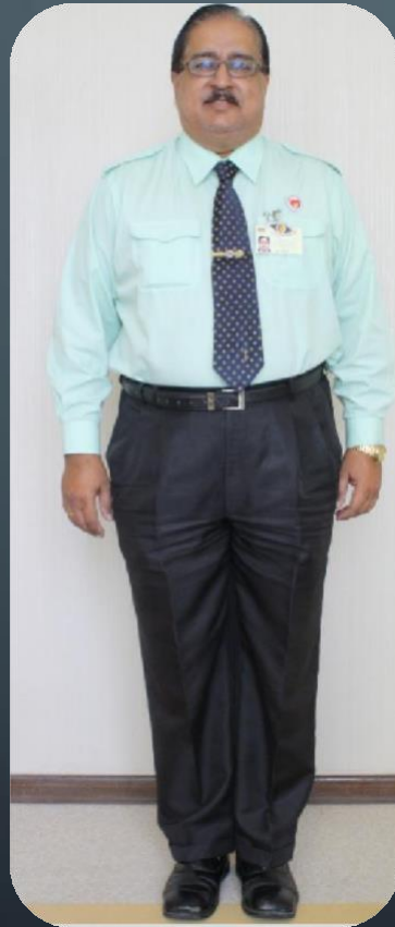
PENOLONG PEGAWAI PERUBATAN