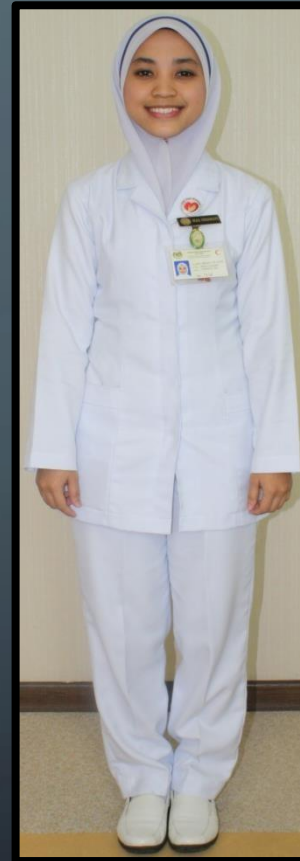
JURURAWAT TERLATIH (PEREMPUAN)