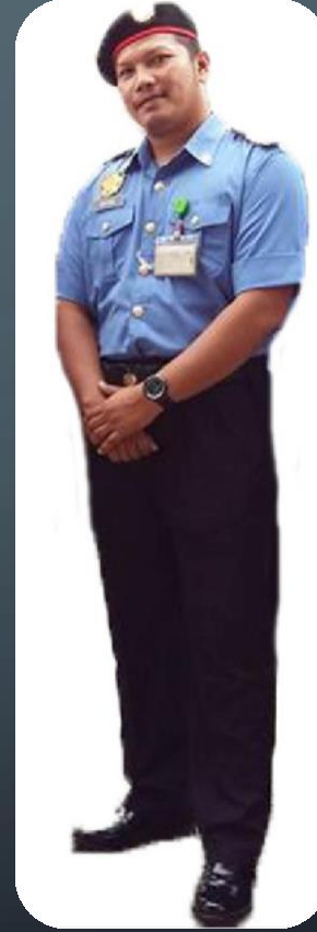
Pegawai Keselamatan (LELAKI)