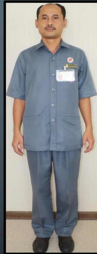
PEMBANTU FARMASI (LELAKI)