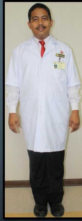
JURUTEKNOLOGI MAKMAL (LELAKI)