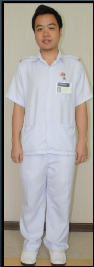
PEMBANTU PEMBEDAHAN PERGIGIAN (LELAKI)