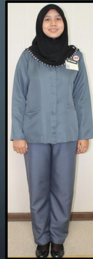
PEMBANTU FARMASI (PEREMPUAN)