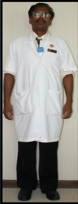
JURU X-RAY (LELAKI)