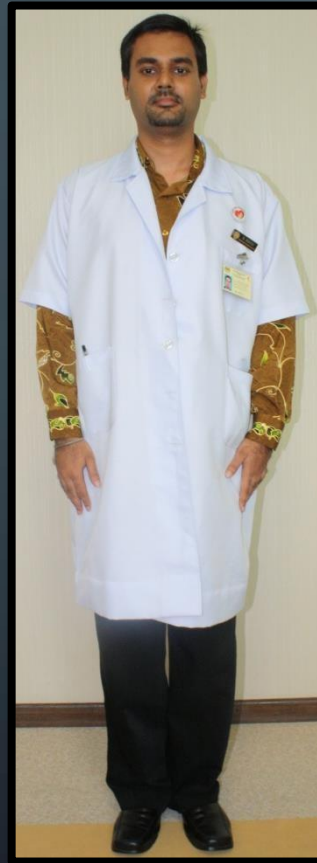
PEGAWAI DIETETIK (LELAKI)