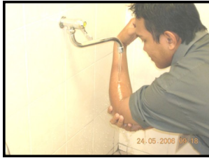
4. Membasuh tangan kiri hingga ke siku