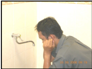
6. Sunat membasuh kedua-dua telinga luar dan dalam