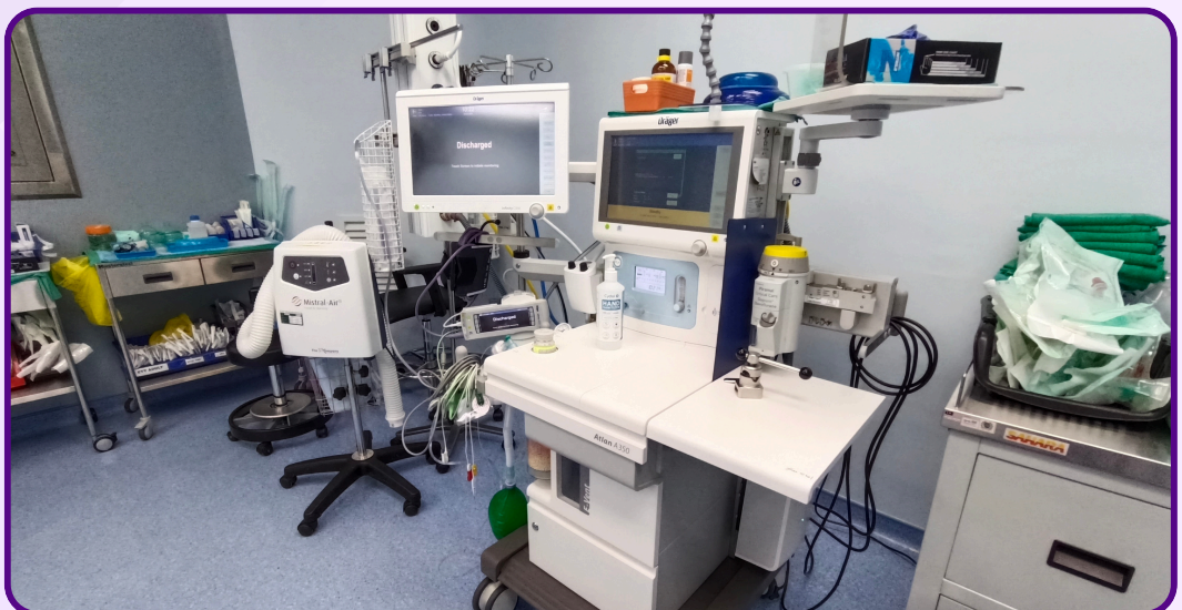
Antara peralatan perubatan yang ada di Kompleks Dewan Bedah