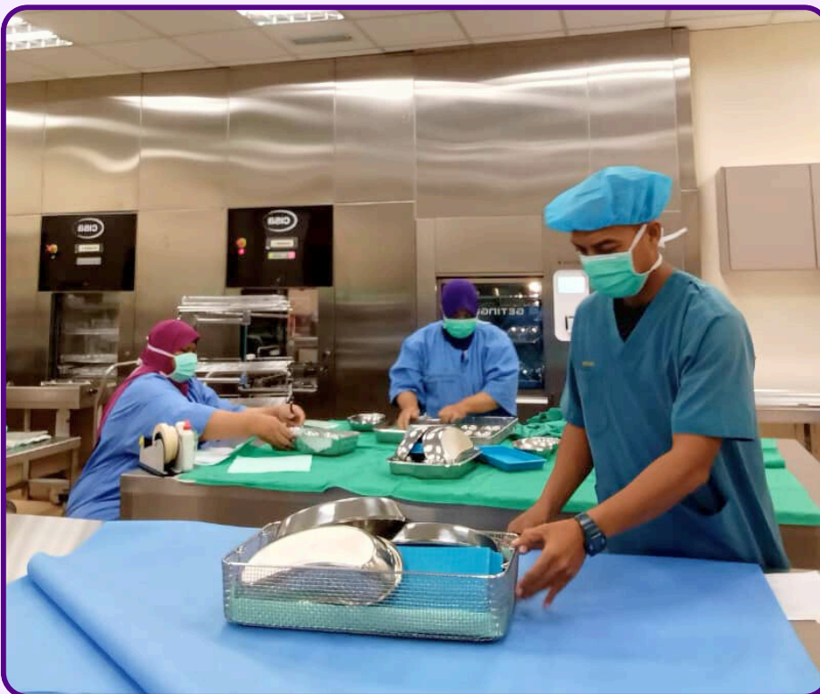
Pengurusan set peralatan