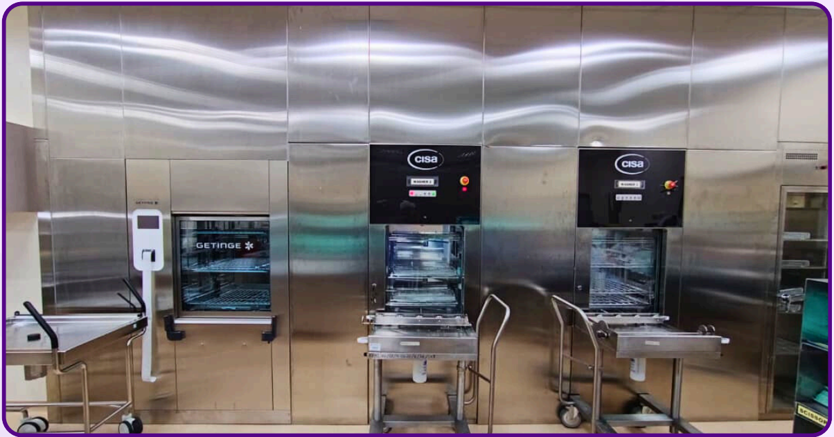
Washer Disinfectors di Unit CSSD