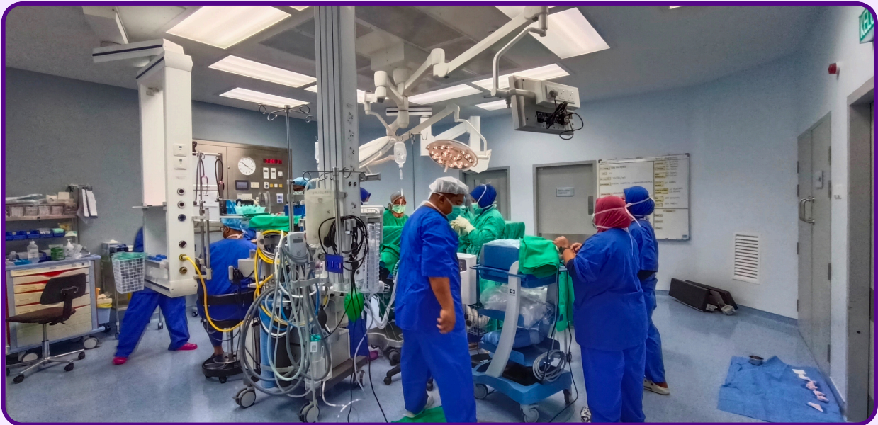
Prosedur dijalankan dalam dewan bedah