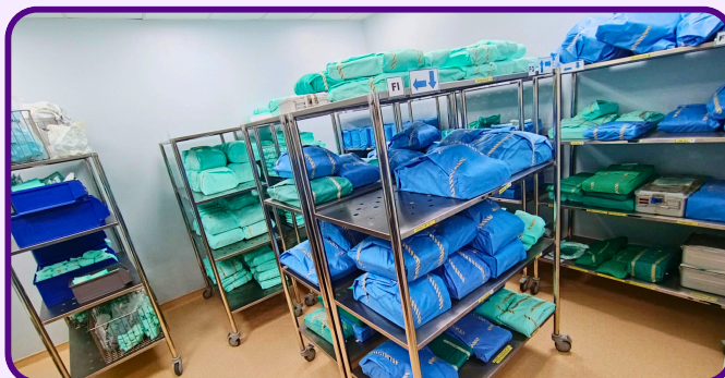
Bilik Peralatan dan Stor Dewan Bedah