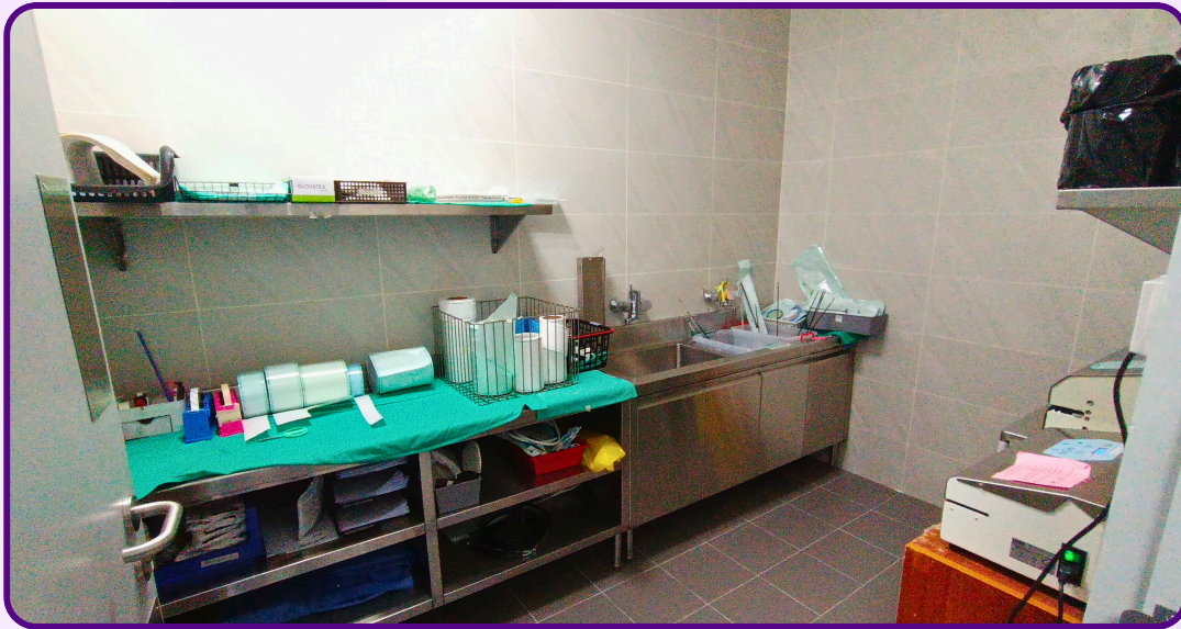
Bilik Utiliti Kotor