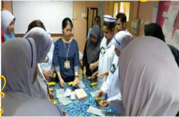
DEMONSTRASI MELAKUKAN KNOT