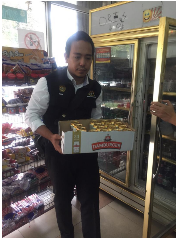
Rampasan produk minuman beralkohol yang menyalahi peruntukan di bawah Peraturan-Peraturan Makanan 1985