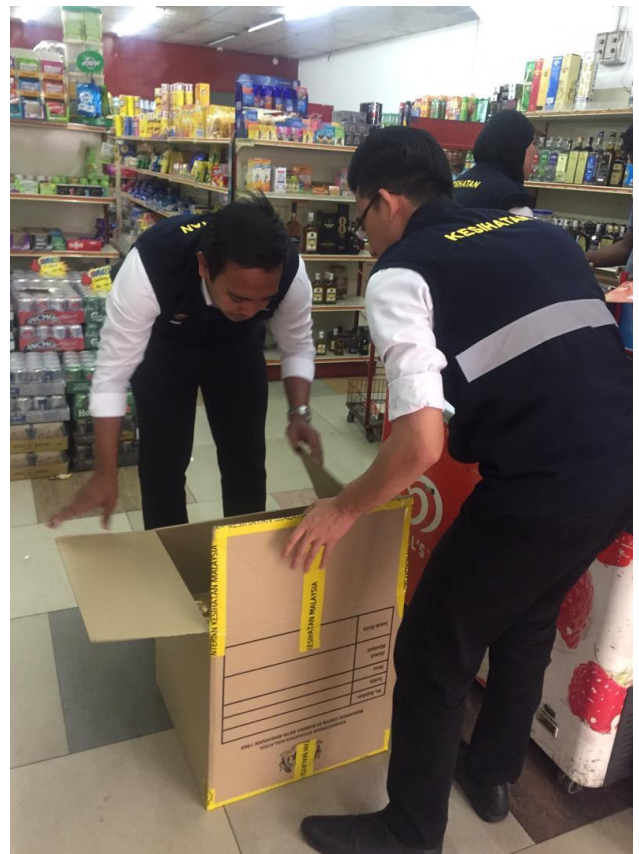
Hasil rampasan "Ops Minuman Beralkohol" sedang disita